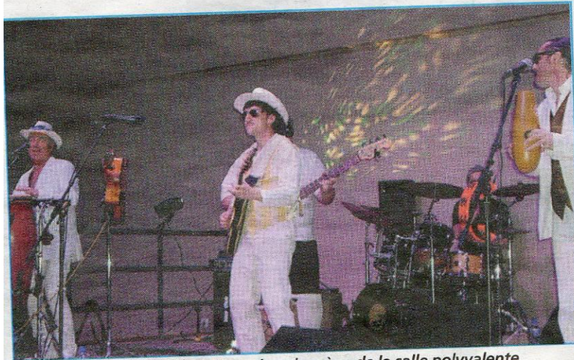
Le groupe Santana's road sur la scène de la salle polyvalente de la Maison d'accueil spécialisée Le Mascaret.

Le groupe Santana's road a donné un concert en faveur des résidents de la maison d'accueil spécialisée (Mas) Le Mascaret, vendredi 6 avril. Le groupe a repris le répertoire du célèbre guitariste Carlos Santana et a également interprété des classiques des années 70. La prestation a été accueillie avec enthousiasme par les résidents, qui avaient tous pris place dans la salle polyvalente de l'établissement. La Mas Le